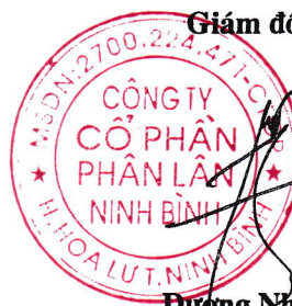
Đương Như Đức